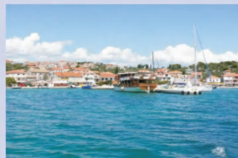
Kaprije, otok Kaprije