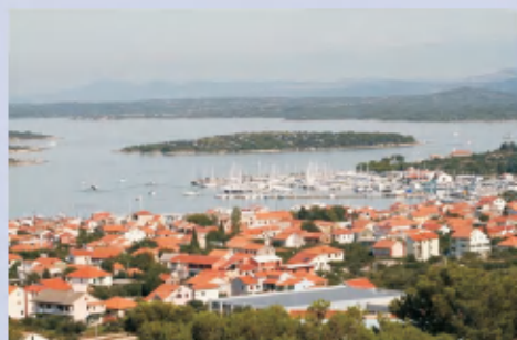
Murter, otok Murter, marina Hramina